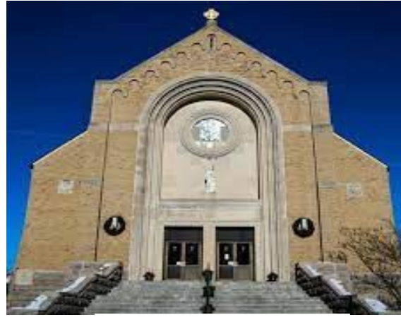
Saint Jude Parish 249 Whittenton Street