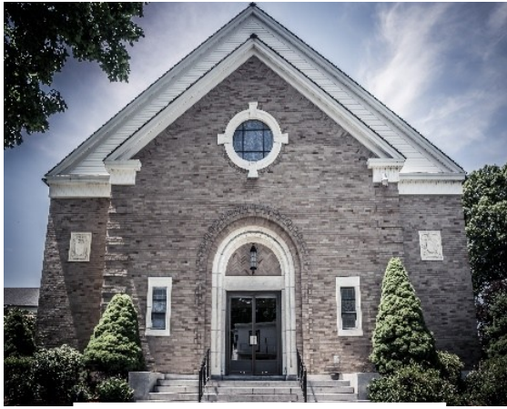
Saint Anthony Parish 126 School Street